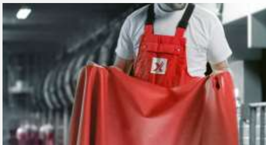
Proizvodnja in obdelava usnja