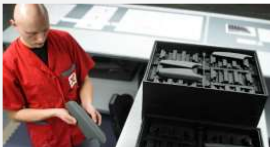
Ovijanje delov z usnjem