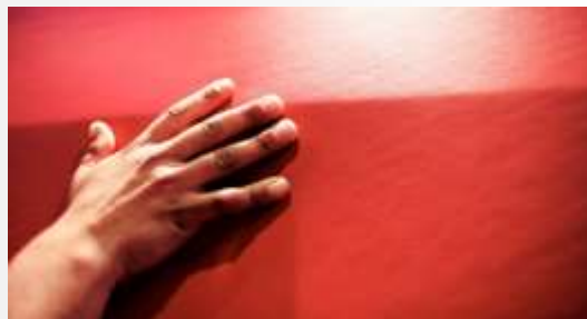
R & R usnje in dizajn