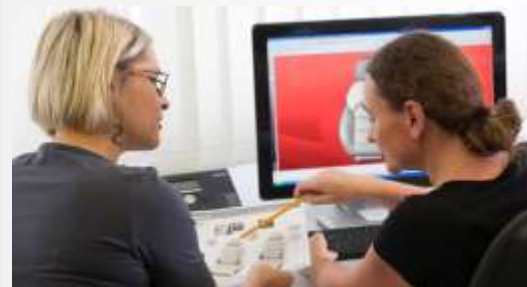
R & R notranjost in dizajn